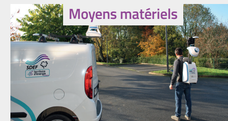
Moyens matériels Deux scanners type LIDAR sur sac à dos et voiture d'une précision de 5 cm