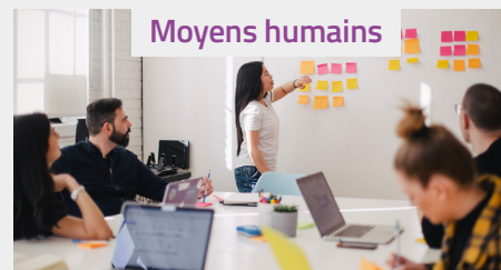
Moyens humains Une équipe de 5 géomètres topographes dans les locaux du SDEF

Pour réaliser le PCRS dans le Finistère (Hors Brest Métropole) en régie, le SDEF dispose de moyens humains et matériels